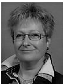
A. Rosema Team manager TA/DA/AA

Het opleidingsteam TA van ROC Noorderpoort Groningen